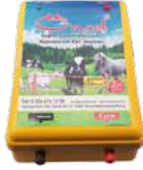
Evcil Hayvan - Pet