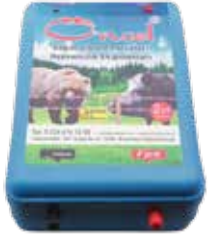
Yabani Hayvan - Wild Animal

ÖC.221-1 Elektrikli Çit Cihazı - Shock Device (Evcil Hayvan - Pet)