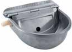
ÖC.242 Paslanmaz Suluk - S/S Drinker